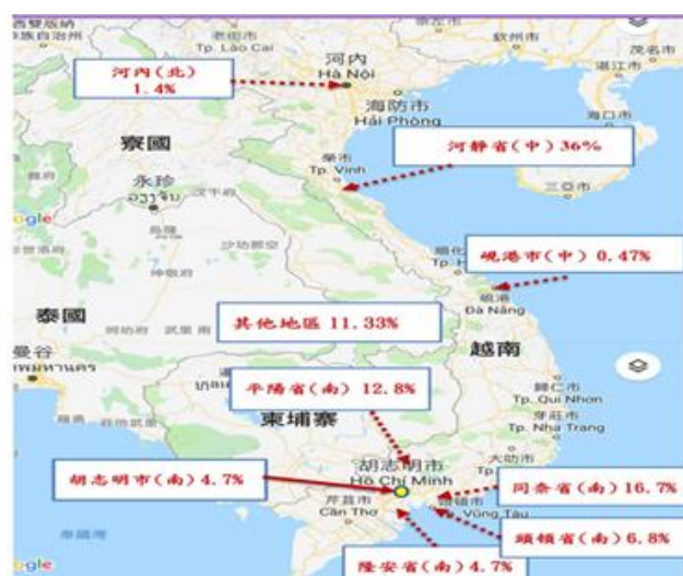
圖六 台商在越南投資的地區

台商在越南的南部地區投資占台商在越南投資總額超過 50%，主要聚集在河靜省、胡志明市、同奈省、平陽省、頭頓省及隆安省六大區域，然而製鞋業、紡織業、自行車業、機車業、木製家具業等勞力密集產業，在越南南部地區已形成上下游之產業聚（本段資料取自：台商赴越南投資策略之個案分析）。