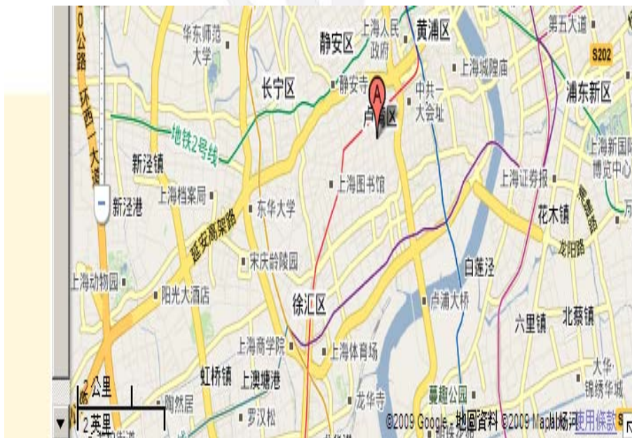
上海新西湖精品酒店