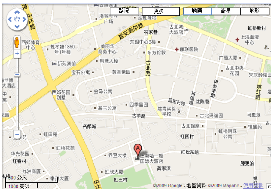
上海哈一頓國際大酒店