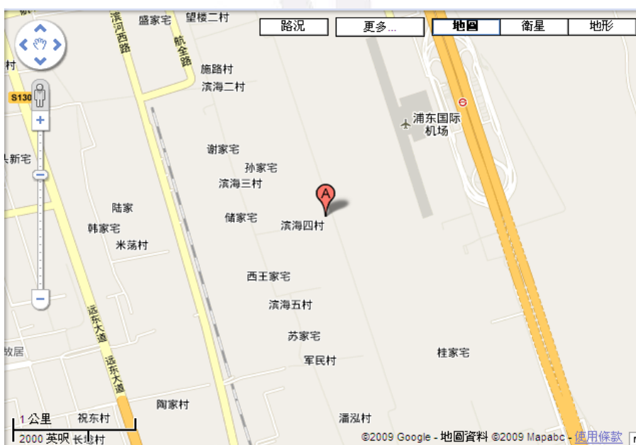
上海浦東國際機場