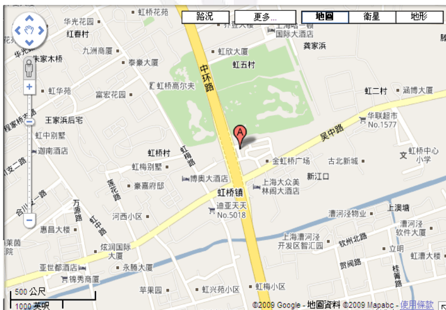
上海恆碩公寓酒店