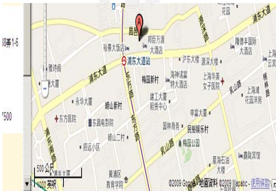
上海海悅濱江酒店公寓