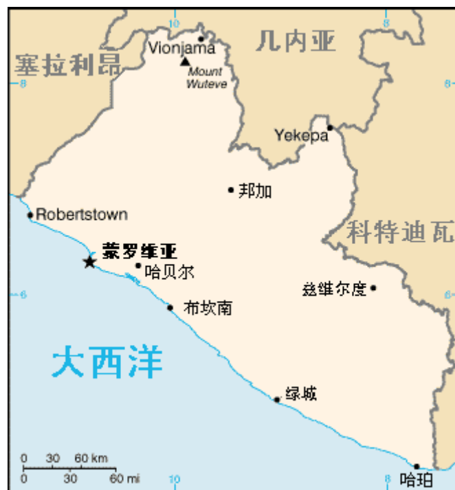
【圖一】獅子山共和國 ( Republic of Sierra Leone )