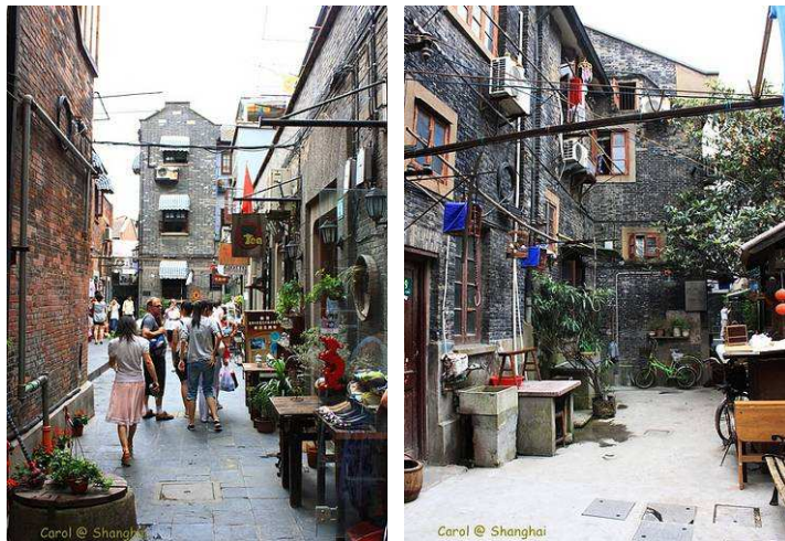
圖 3-1 中國上海市泰康路 210 弄-田子坊

「小巷弄」是城市生命力的出發點。但往往我們都被「大馬路」的思維所左右，而忽視巷弄生活的力量，認為城市的發展就是在大馬路上建起一棟棟新潮的量體，包括商業大樓、金融中心、國際飯店、豪宅、高鐵捷運等，才能代表城市的生活水準與競爭力已得到提昇。 2 因此我們必須破除這樣的思維，重新帶動起小巷弄的生活風潮，畢竟對創意城市而言，進步的指標不是在於大馬路的新穎建物，而是在街道上令人驚艷的空間魅力，如上海的田子坊。