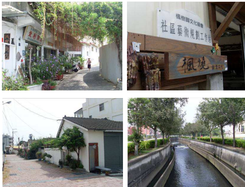
圖 2-1 台中市南屯區楓樹腳社區

「專案式」街區組織，是為了某一特定目的或地域的需求而集結各團體所成形的，並無特定形式。其團體的類型多元，包括了私人企業、慈善機構以及空間規劃專業人員等，一方面實質的解決問題與需求，另一方面也可配合政府的規劃人員，共同創造社會福祉及美化環境，如長庚醫療財團法人機構所創辦的「長庚養生文化村」以及宜蘭的「傳統藝術中心」，就是為了造福社會大眾所建立起的特殊社區組織。