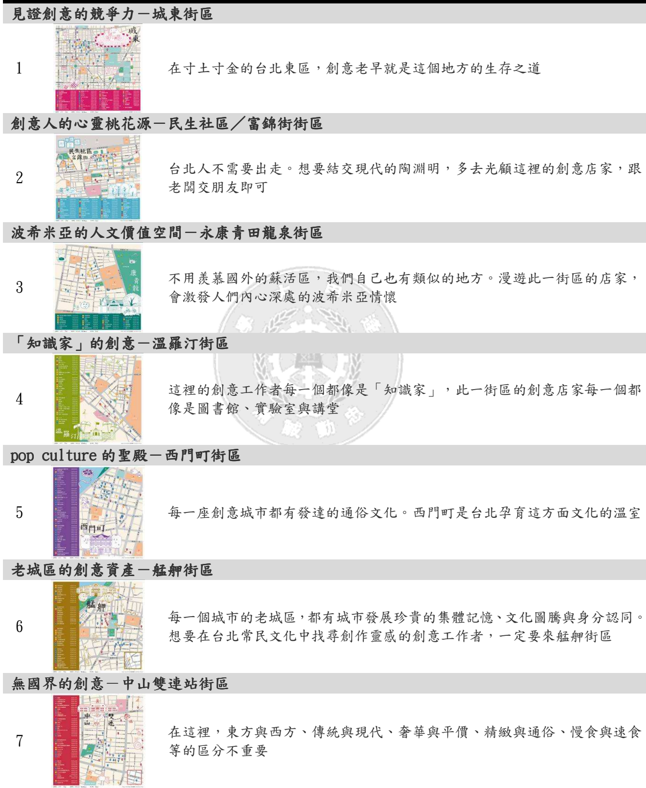
表 3-1 台北創意街區地圖