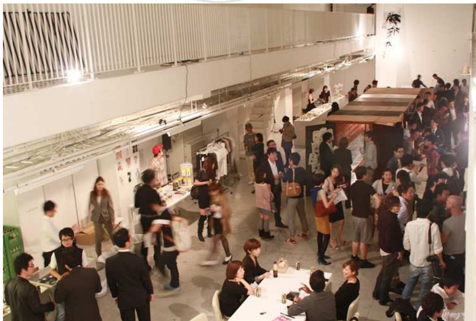
圖 3-3 創意工作者的交流聚會