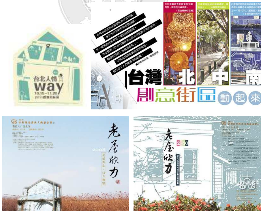
圖 1-1 創意街區

對於這股南移的潮流，台北的執政單位也意識到城市吸引力的重要性，開始著重於在地的特色風貌與生活，創造充滿文藝氣息的城市風格，藉以改善台北庸碌的氛圍以及吸引創作人來此進駐，而在現行推廣成功的個案中，又以「創意街區」的活動最為響亮、高人氣。落腳於小巷弄中的特色商店，不僅風格多元頗具個人特色，同時以「街區」為單位，形成獨特的創意聚落，帶動起台北發展成創意城市的特質。同樣地，這股南移的潮流到了南台灣，掀起了不同於台北的改革思想，而其中最廣為人知的就屬台南的「老屋再造」風潮。雖然全台各個區域都有老屋翻新再利用的案例發生，但都不及台南推廣效法得如此密集且風格顯著，且其所張顯出來的街區氛圍又與台北創意街區截然不同，形成另類的城市特色。