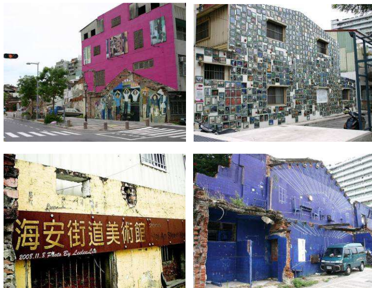
圖 4-1 台南市安海路-藝術造街場景

雖然說，把有古味的東西放在老屋裡面是「最省成本」的做法，可這並不代表把一堆老家具擺在一起就是復古。復古的風格不是不能做，但一定要有自己的風格與故事。