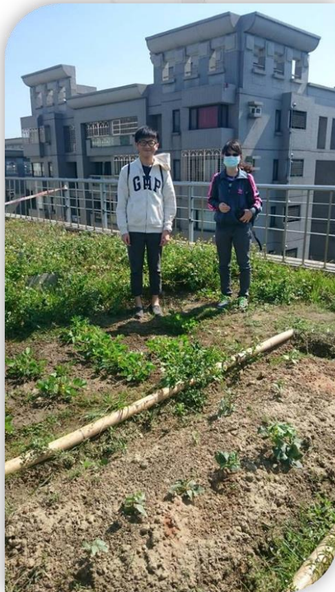
圖十九 11/2 組員合影的照片