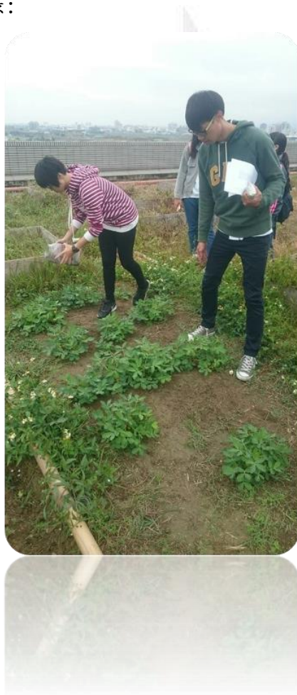
圖二十二 組員施肥的照片