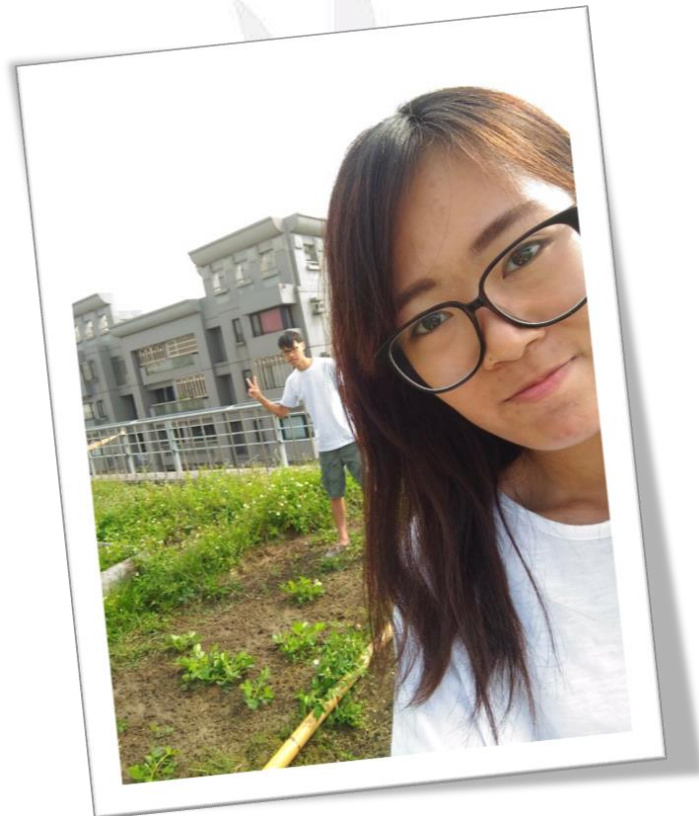
圖十二 10/25 組員合影的照片