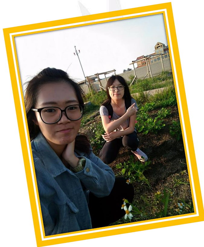
圖十八 組員合影的照片