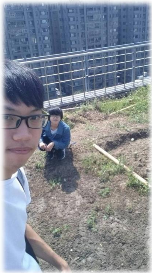
圖六 10/14 組員合影的照片