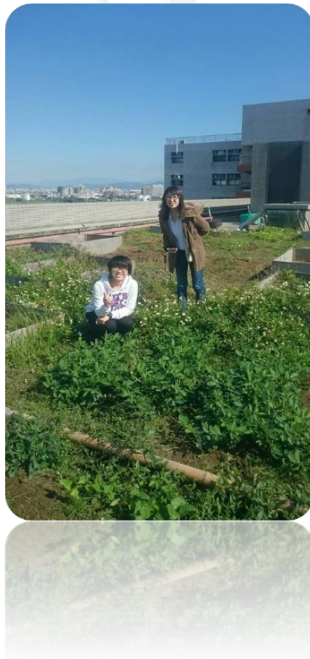
圖三十六 組員合影的照片