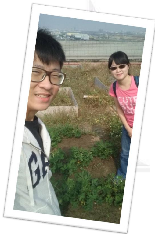
圖二十五 組員合影的照片