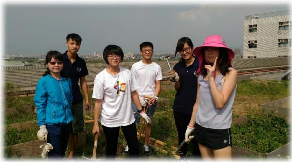
圖三 鋤草後組員大合照