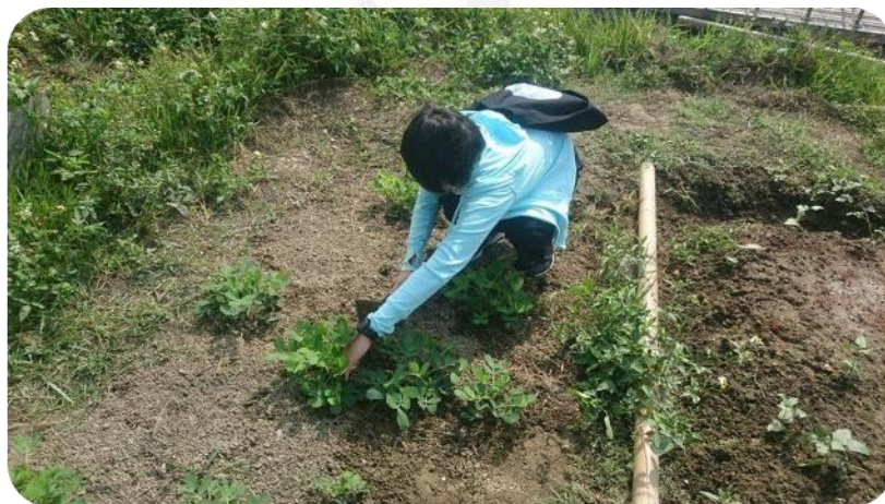
圖十七 10/28 莉婷的個人照片