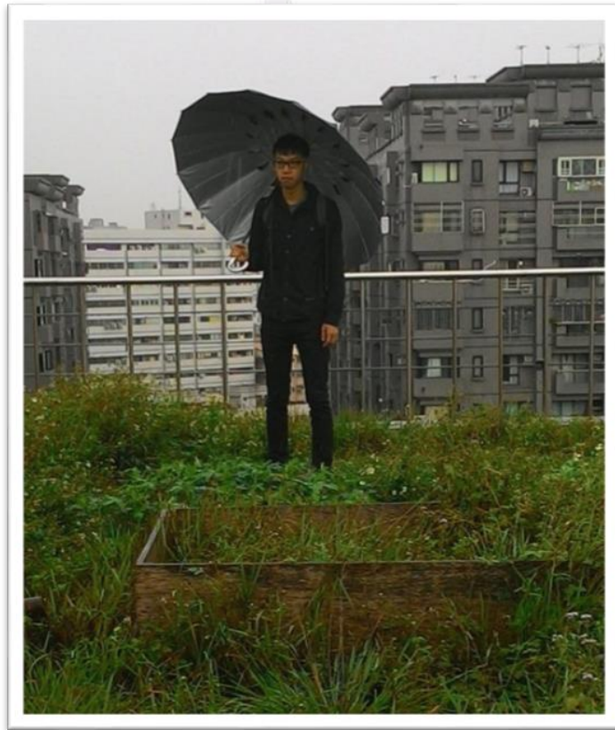
圖二十七 雋恩的個人照片