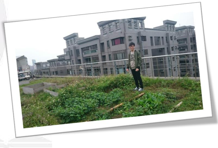
圖三十五 威誠的個人照片