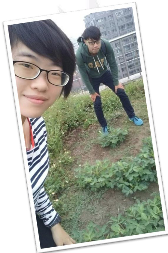
圖二十六 組員合影的照片