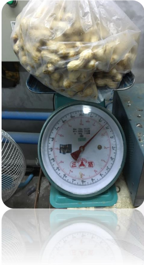
圖四十二 花生秤重的照片