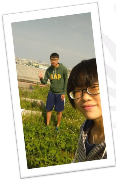
圖三十二 組員合影的照片