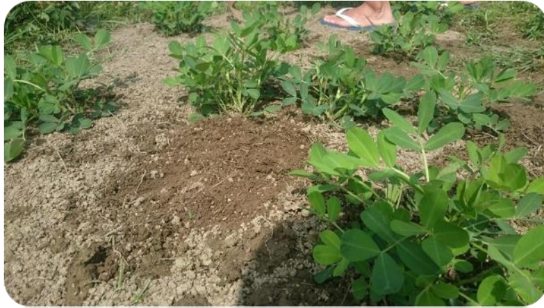
圖十六 花生生長概況照片