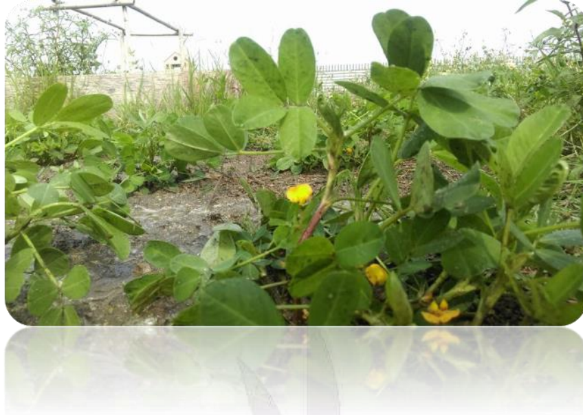
圖二十一 花生生長概況照片