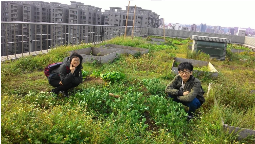
圖三十九 組員合影的照片