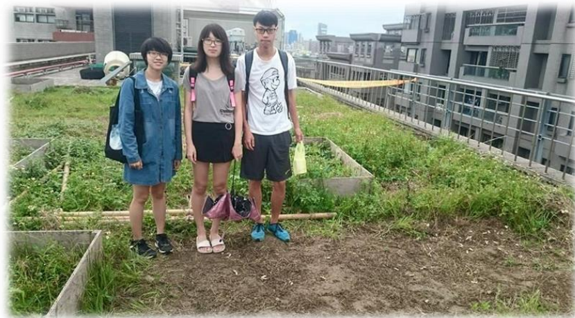
圖四 10/7 組員合影的照片