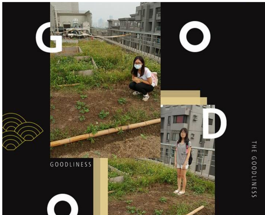
圖七 10/18 組員合影的照片