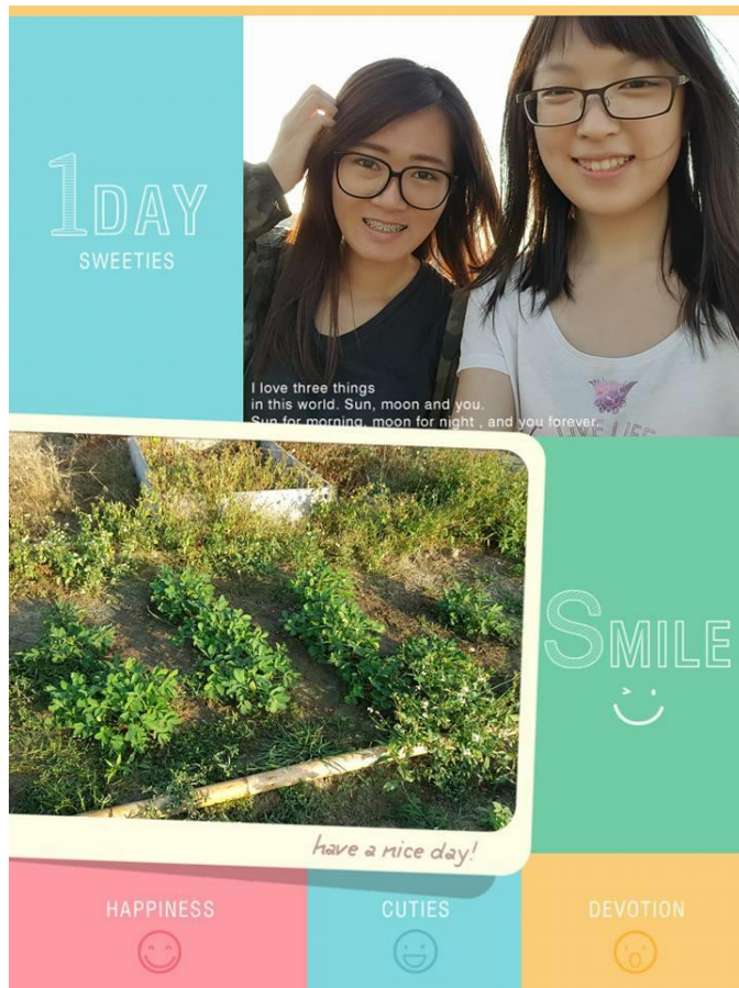
圖二十四 組員合影的照片