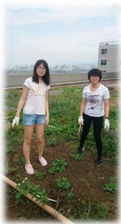
圖十 10/21 組員合影的照片