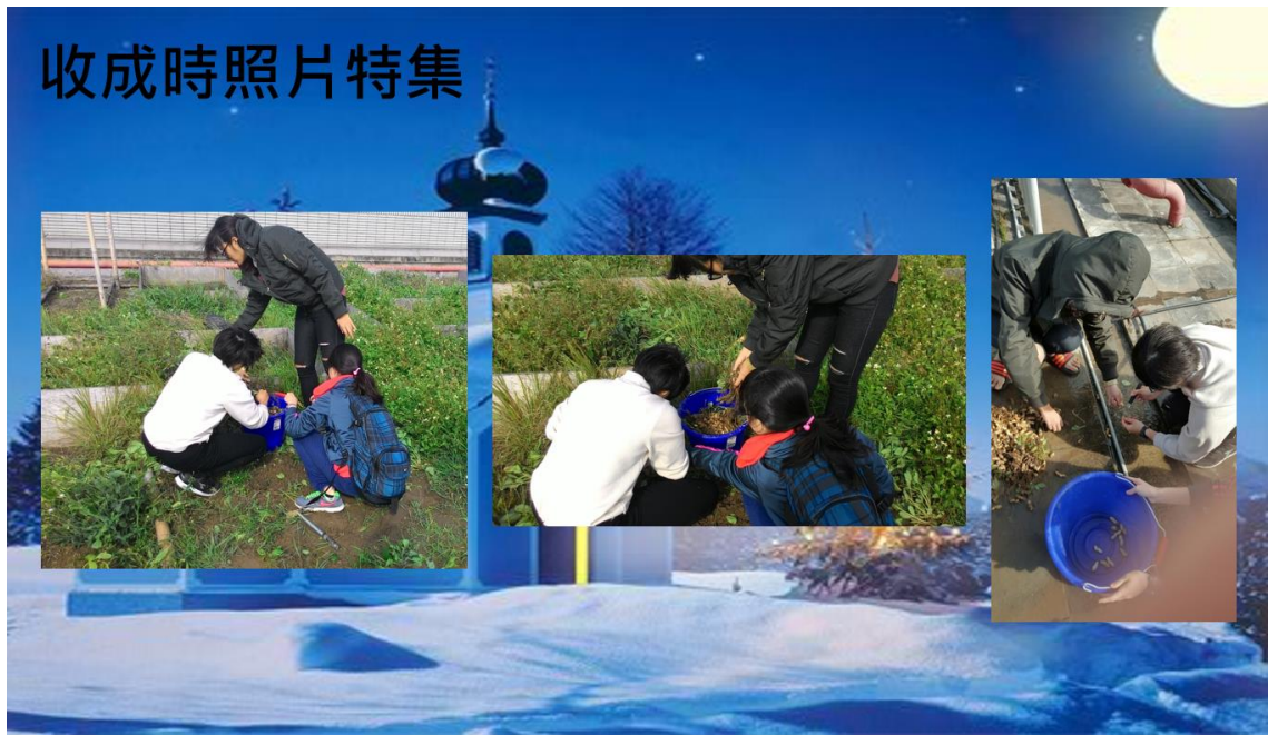
圖四十一 收成時的照片