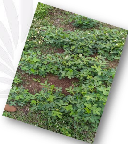
圖三十 花生生長概況的照片