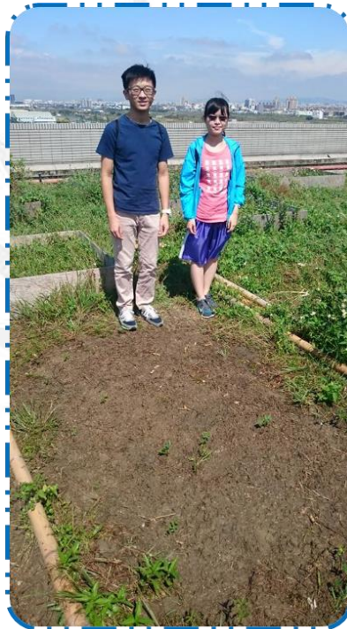
圖五 10/12 組員合影的照片