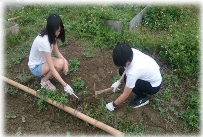
圖十一 10/21 組員鋤草的照片