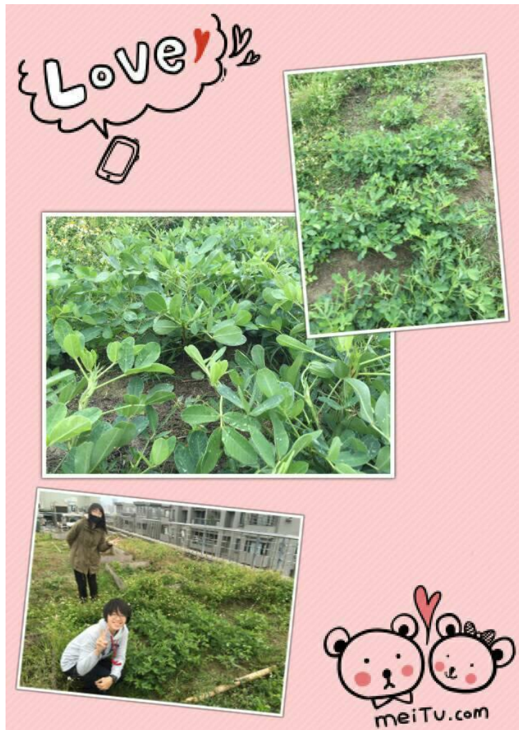
圖三十八 組員合影的照片