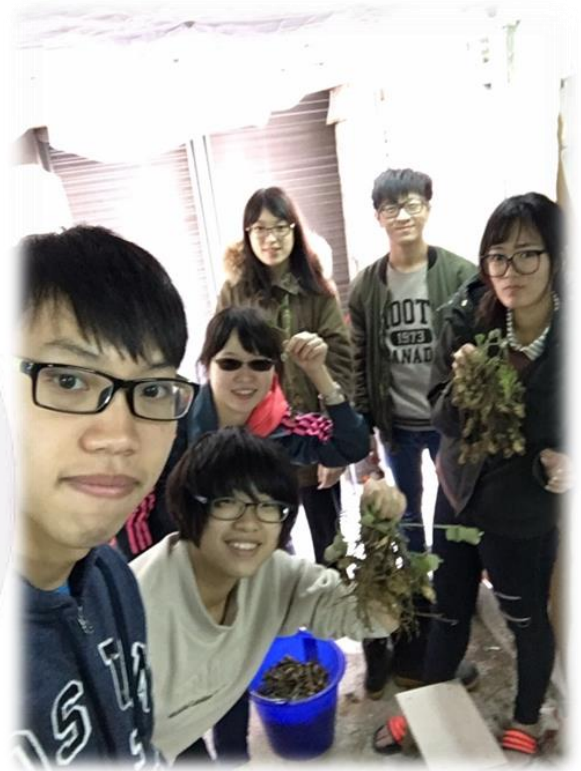
圖四十三 花生收成後全體組員合影