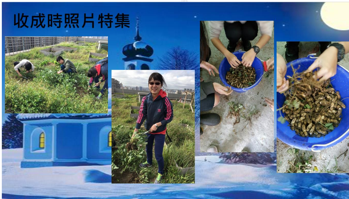
圖四十 收成時的照片