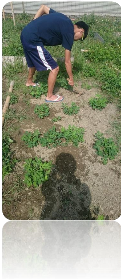
圖十五 10/28 雋恩的個人照片