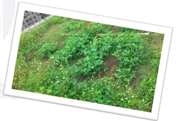
圖三十三 花生生長概況的照片