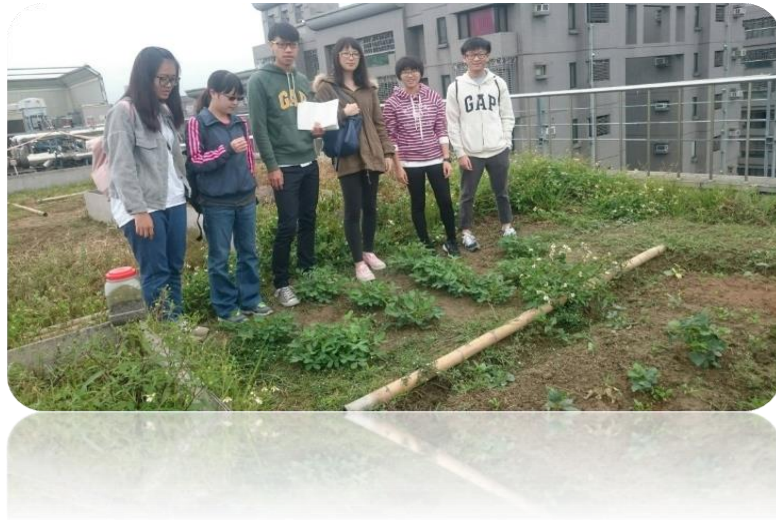
圖二十三 組員合影的照片