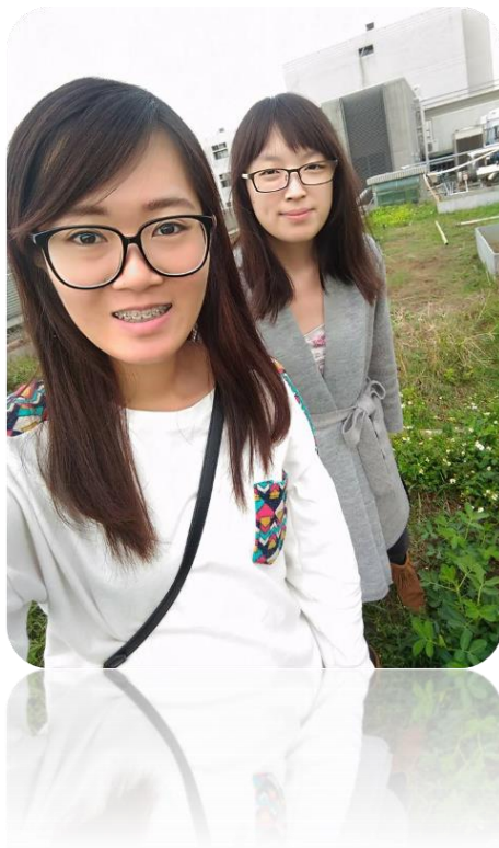
圖二十九 組員合影的照片